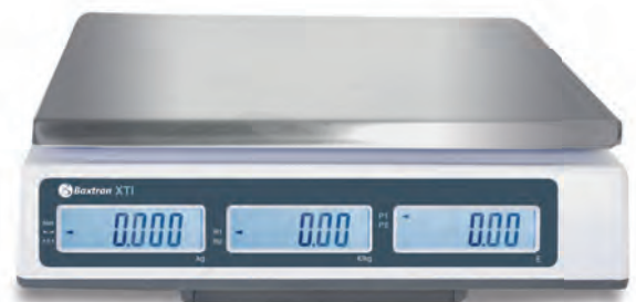
Três ecrãs comprador retroiluminadas