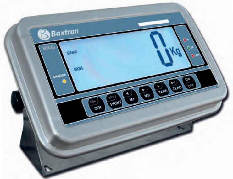
Visualização função no ecrã