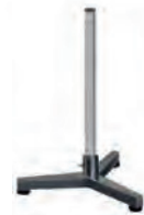
Coluna de aço verniciado