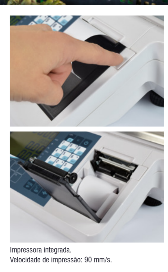
Impressora integrada. Velocidade de impressão: 90 mm/s.

8 PLU DIRETOS | 4 V VENDEDORES | DUPLO TELA PREÇO/PESO/VALOR/TARA